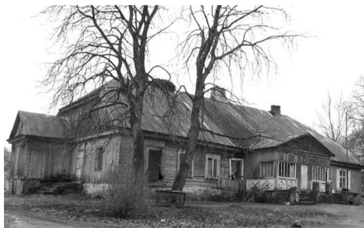
Jakšiškio dvare kadaise buvo gaminamas krakmolos.

„Tas dvaras nėra labai senas. Jis yra buvęs didelis ūkinis vietas. Čia veikusios dirbtuvės gamino krakmolą. Tarybiniais metais pastatai buvo pertvarkyti į sandėlius, o gyvenamasis pagrindinis namas buvo prita-